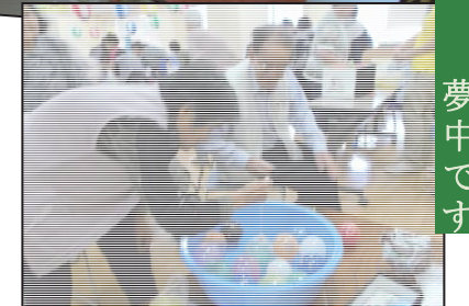
ヨーヨー釣りに夢中です