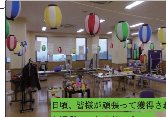
日頃、皆様が頑張って獲得された「みかん通貨」でお支払です！！

6月16日～18日の3日間デイサービス祭りを行いました！！内容はヨーヨー釣りやバザー、ガラポン抽選、かき氷、カステラ焼きなど内容盛りだくさんで皆様楽しんで頂けたようです^^♪