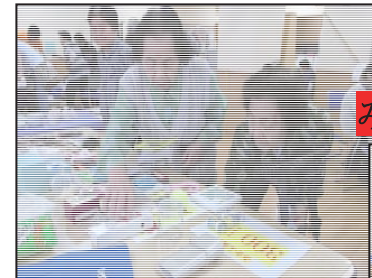
バザー商品を吟味中♪

6月16日～18日の3日間デイサービス祭りを行いました！！内容はヨーヨー釣りやバザー、ガラポン抽選、かき氷、カステラ焼きなど内容盛りだくさんで皆様楽しんで頂けたようです^^♪