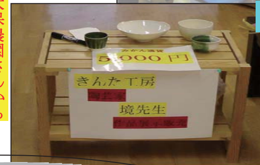
陶芸教室でお世話になっっている先生からも作品を頂きました

初めてのデイサービス祭りとおあってみなさんがどんな反応をするかドキドキでしたが楽しんで頂けたようです♪また、今回は職員からのたくさんの方のバザー商品の寄付やいつもお世話になっている大保農園さんからお花を頂いたり、陶芸教室の先生からも作品をいただきました。その他にも地域の方のボランティアがありたくさんの方からのご協力があり本当に感謝です。