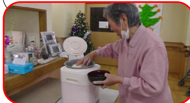
アツアツのお餅！！出来あがって、嬉しそうです♪