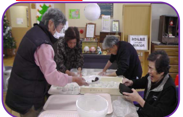
皆で楽しく、ワイワイと楽しそうでした♪