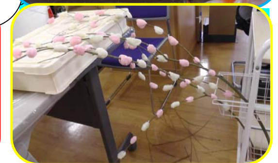
木の枝に紅白のもちを付けて、花餅の出来上がり。施設の玄関に飾りました。