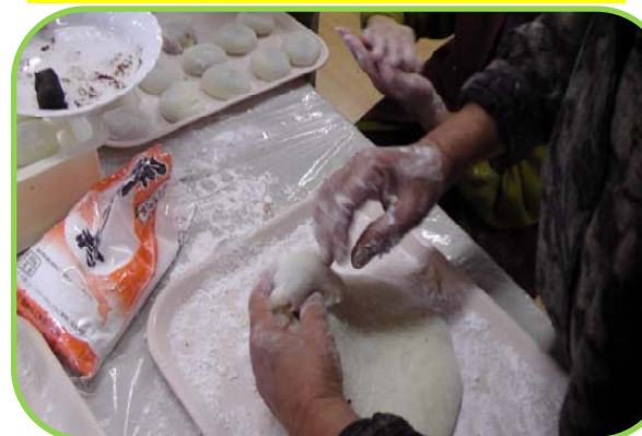
慣れた手つきでこねていました^^

感染性胃腸炎やノロウイルスなどの感染症が流行しています。 手洗い・うがいの習慣を徹底しましょう。